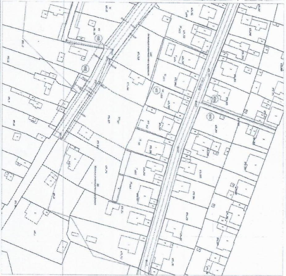
Областен център на гр. ПУЛИС, ул. "13 ВЕК" № 10. Проект за изменение на ПУП - ПУЗ. ЧАСТ ПЛАН ЗА РЕГУЛАЦИЯ