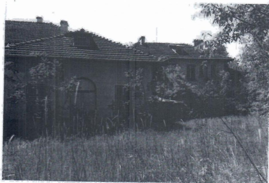
ОВЛ от северната страна