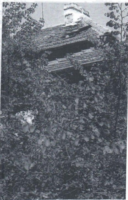
Част от падналия покрив от южната страна