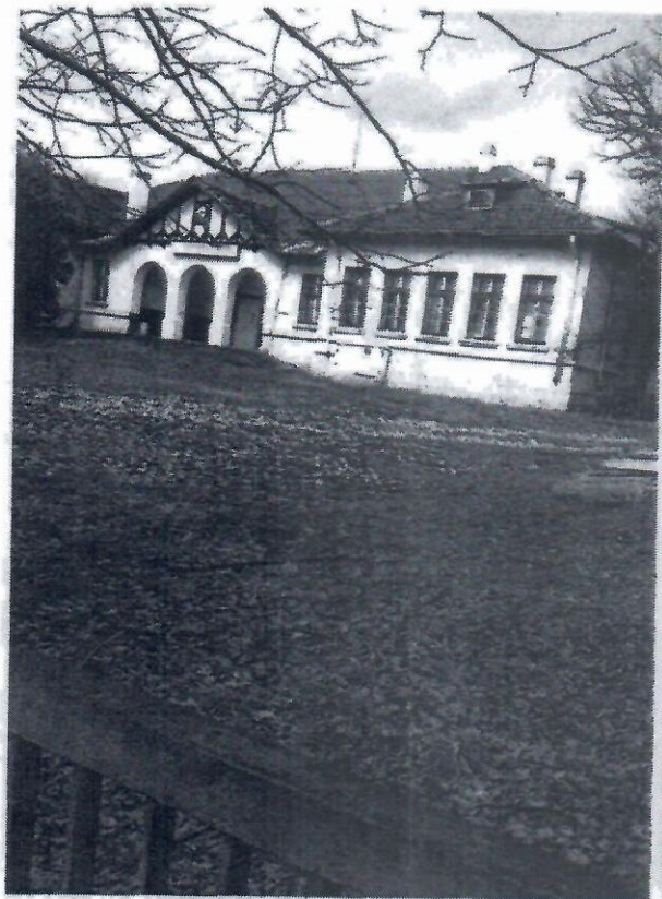
ОВЛ от към южната страна