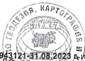
Схема № 15-943121-31.08.2023 г. издадена въз основа на заявлен 31.08.2023 г.