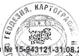
Схема № 15-943121-31.08.2023 г. издадена въз основа на заявление № 15-943121-31.08.2023 г.