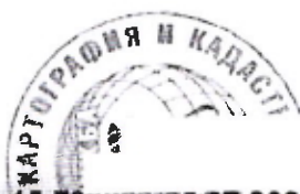
Схема № 15-798223-25.07.2023 г. издадена въз основа на заявление с входящ № 01-416172-25.07.2023 г.